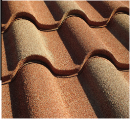
Villa kiremit çatı