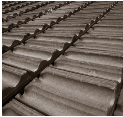
Klasik kiremit çatı