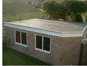
Düz beton çatı